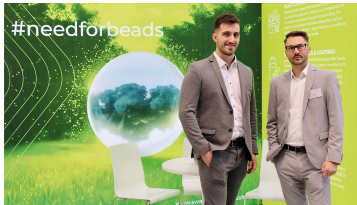
Der neue Messestand von SWARCO Indusferica feiert sein Debut auf der Fakuma 2024.

Auf der diesjährigen Fakuma haben wir mit einem frischen, modernen Messeauftritt begeistert. Unser neues Standdesign, das den industriellen Charakter unserer Lösungen betont, sorgte für viel Aufmerksamkeit und zeigte die technologische Stärke von SWARCO. Der Fokus lag klar auf Innovation und Fortschritt – das bisherige Marmor-Design wurde bewusst durch einen zukunftsweisenden Look ersetzt.